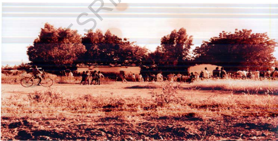
Cliché Gollé Esaïe, le 5 novembre 2006, Pouss.