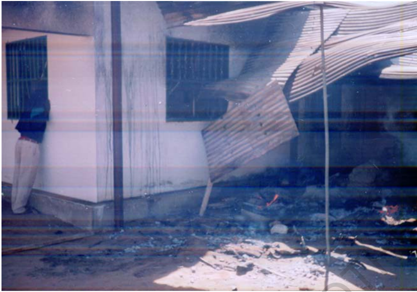
Photo n° 3 : Incendie et destruction de la résidence du Délégué SEMRY de Maga par les manifestants.