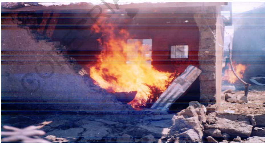
Photo n° 4 : Incendie et destruction en cours de la résidence du chef de zone de Pouss

le 09 novembre 2006 à Pouss